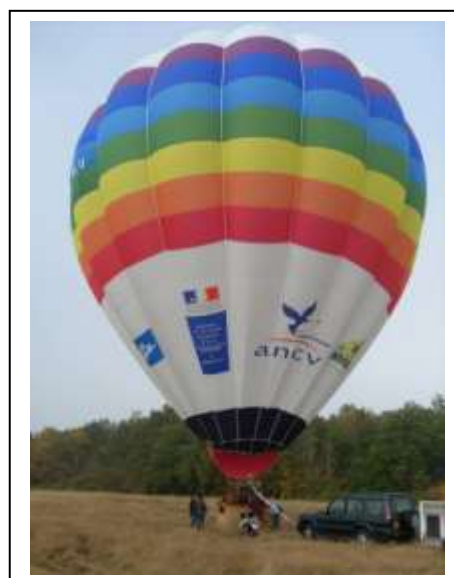
Essai au sol