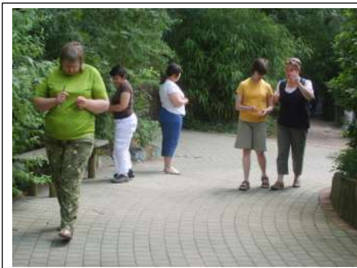
Au zoo de La Flèche