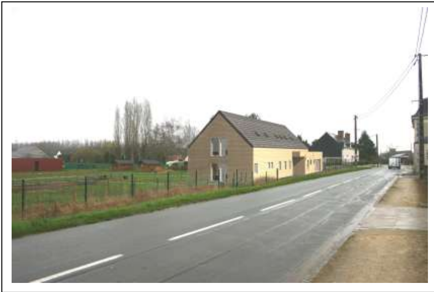
La Maisonnée de Rivarenes

Les perspectives des bâtiments dessinés par l'architecte :