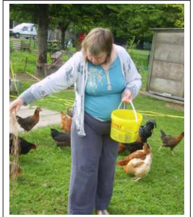
A la ferme de Vouvray