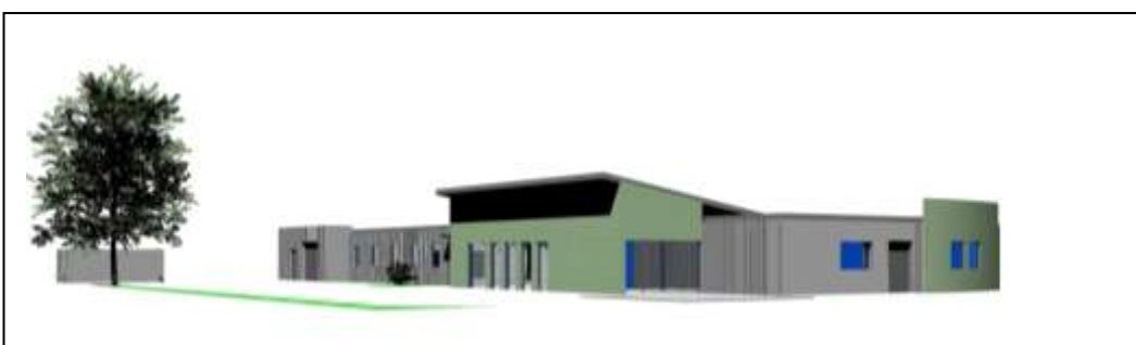
Le site de La Loge