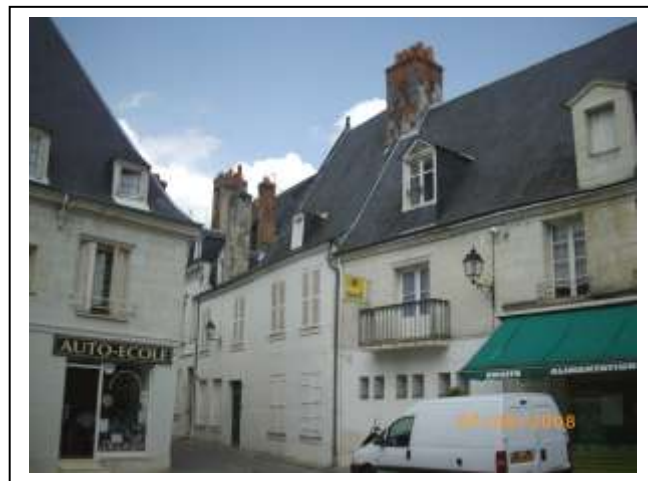
La Maisonnée rue Gambetta