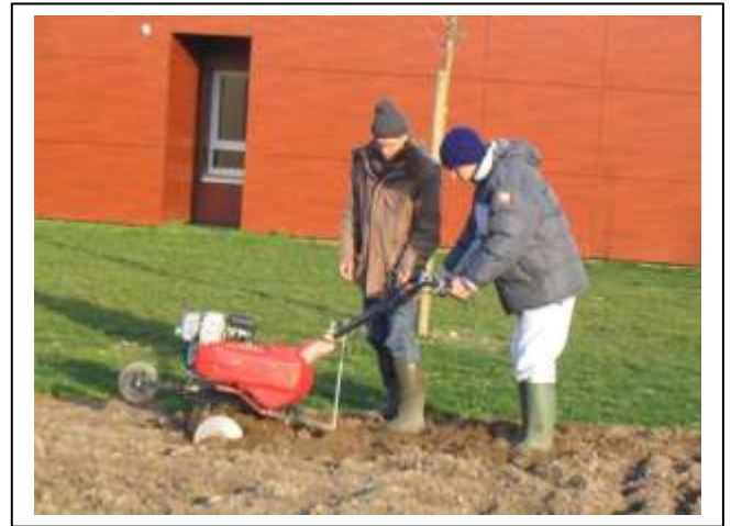
Le futur jardin :