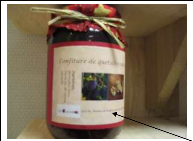
Les nouvelles étiquettes