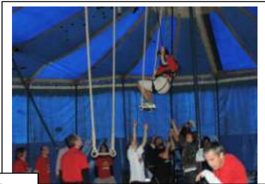
Trapèze et équilibre