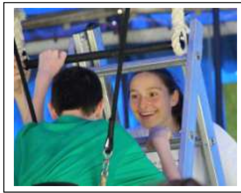
Le sourire : svmbole de la journée