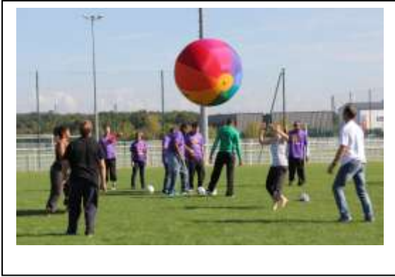
Foot et kinball