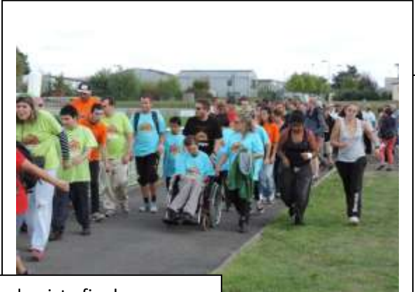
Tour de piste final